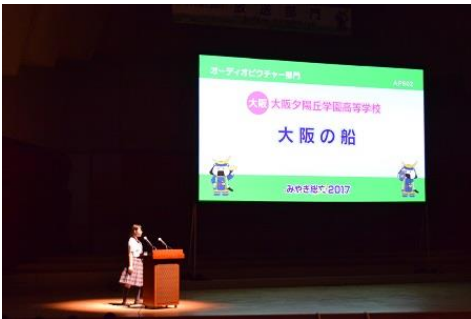
オーディオピクチャー部門 大阪建設局が運航をしている渡し船を取材しました。