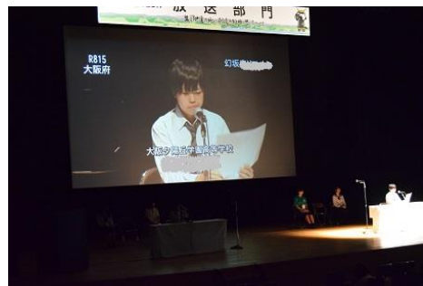
朗読部門 発表の様子 様子がスクリーンに映し出されます。 有栖川有栖の「幻坂」を選びました。