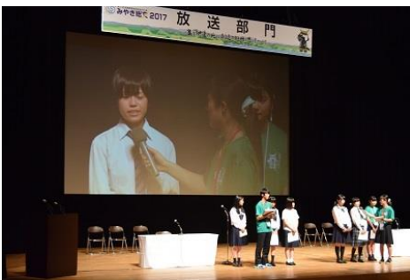
朗読部門発表後、インタビューを受けました。