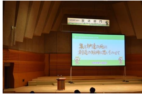
映像の発表会場です。