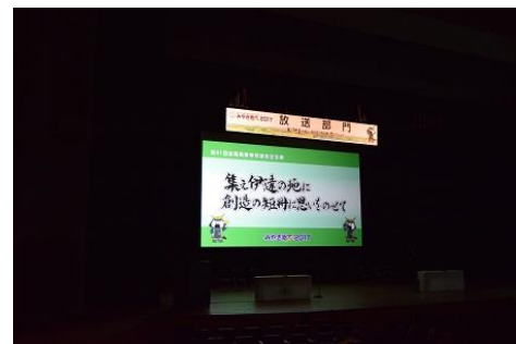
朗読・アナウンス部門の発表会場 「集え伊達の地に 創造の短冊に思いをのせて」がテーマです。